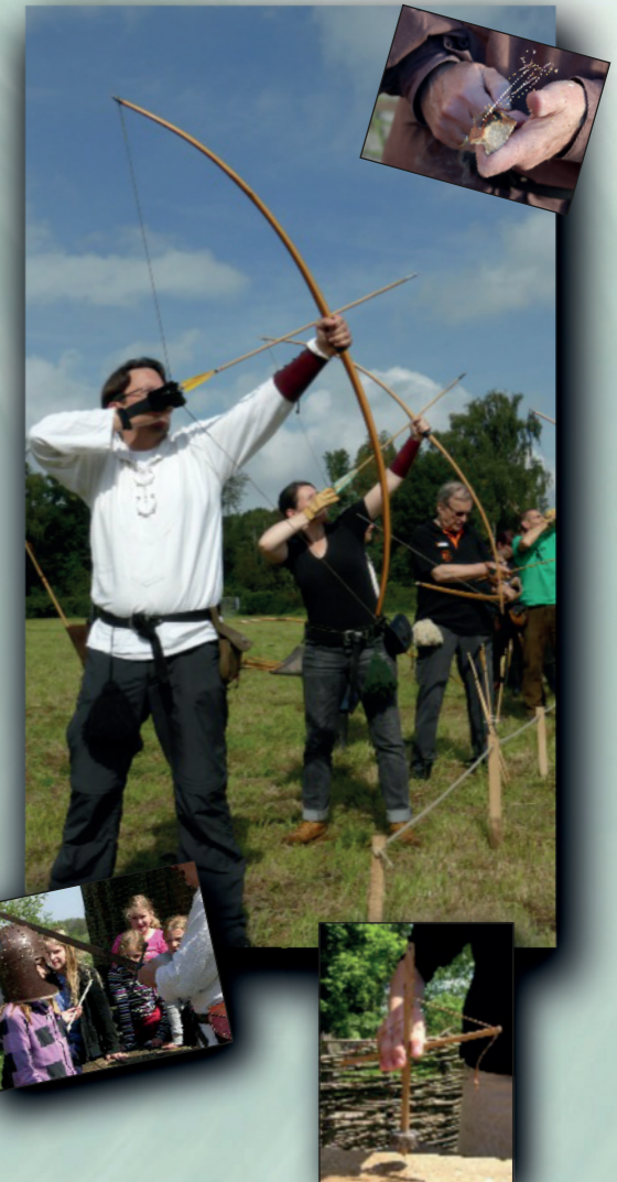
© AGIL 2023 Text: F.Andriashchko, Layout: H.Fricke